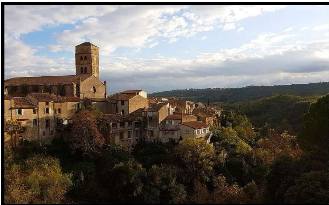
Village du Livre, Montolieu

Ce séjour peut s'effectuer suivant d'autres formules plus courtes ou plus longues, selon vos envies. Suivant vos propres critères, contactez-nous au plus vite pour que nous puissions vous faire une proposition au plus proche de vos attentes.