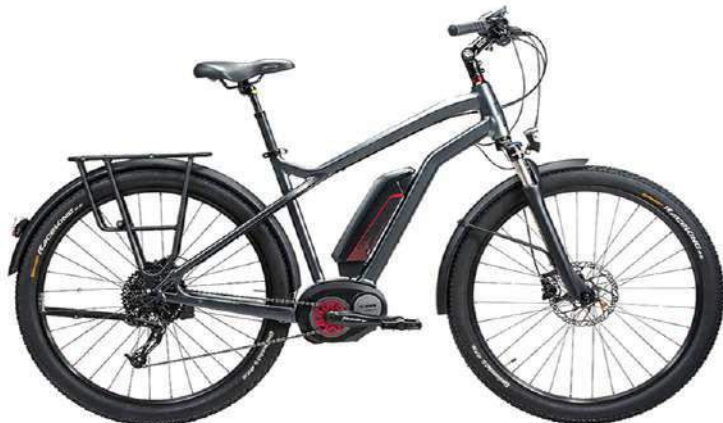
Moustache, « Samedi 27 XROAD »

Le Samedi 27 Xroad tire parti du potentiel des roues en 27.5" et des pneus Continental Race King, très roulants mais très confortables et accrocheurs grâce à leurs nombreux petits crampons. Equipé de garde-boue, béquille et éclairage performant, Samedi 27 Xroad est équipé pour être efficace en usage quotidien.