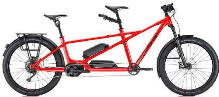
Moustache, « Tandem électrique » Confortable

Son cadre, sa suspension AV, sa tige de selle suspendue, ses roues 27.5, et sa transmission 10V à large amplitude 14x11/42 autorisent un usage tout terrain, même dans de forts pourcentages. Il est équipé du système Bosch Active en 400 Wh.